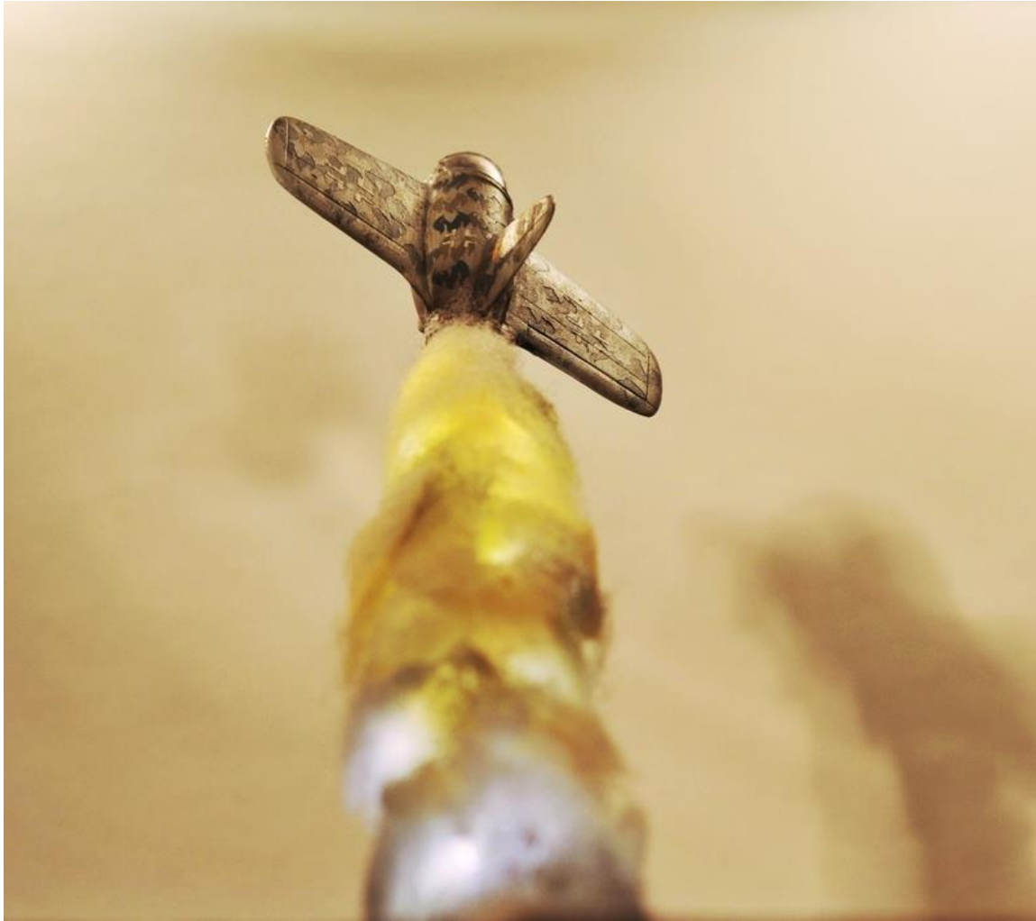
La vache on voit même les épaisseurs de peinture!!!